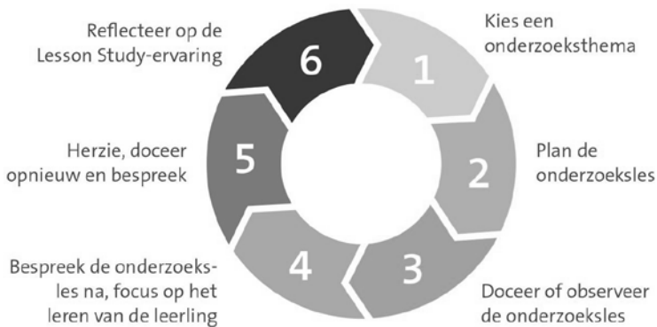
Figuur 1. De Lesson Study -cyclus 13 .

Lesson Study is een van oorsprong Japanse professionaliseringsaanpak die leraren stimuleert te focussen op het leren van leerlingen. In een Lesson Study doorlopen leraren in teamverband een cyclus met verschillende stappen om het leren van een specifiek onderwerp door leerlingen te verbeteren (zie Figuur 1). Leraren analyseren daarbij kritisch en systematisch de leerprestaties van leerlingen, en verbeteren zo hun (vak)didactisch handelen.