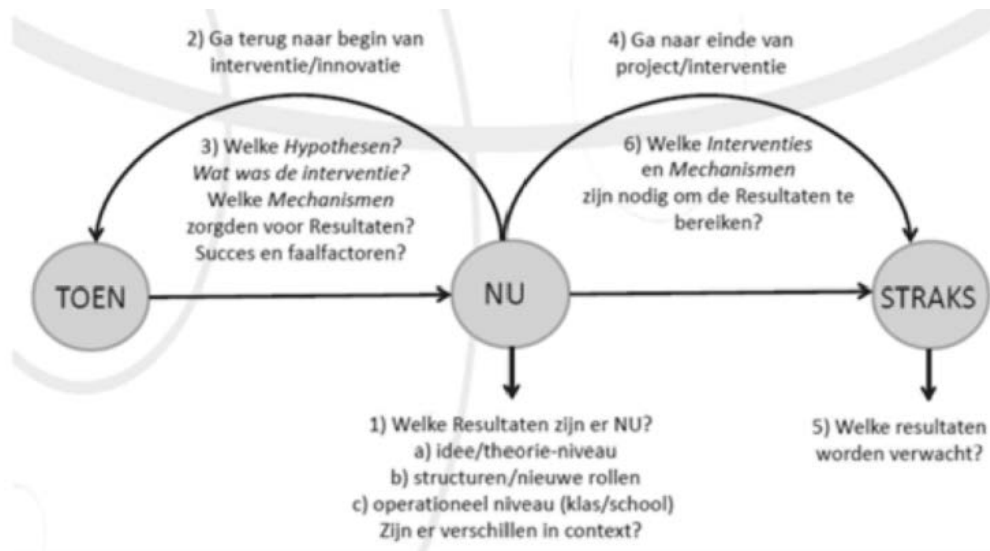
Figuur 3. Schematische weergave van verklarende evaluatie (Pater, Sligte & van Eck, 2014)

waarom? Een verklarende evaluatie geeft dus inzicht in hoe en waarom een interventie werkt en heeft daarbij nadrukkelijk aandacht voor de context waarin mechanismen spelen. De vraag is hoe het beleid in de praktijk uitpakt. Welke mechanismen maken dat de interventie ‘werkt’? Antwoord op dit soort vragen laat zien wat precies bijdraagt aan het ontstaan van ‘best’ en ‘bad’ practices en helpt ook de achterliggende succes- en faalfactoren te identificeren. Verspreiding van die kennis en ervaringen kunnen bijdragen aan het bijsturen van de implementatie van ICT in het onderwijs in de beoogde richting.