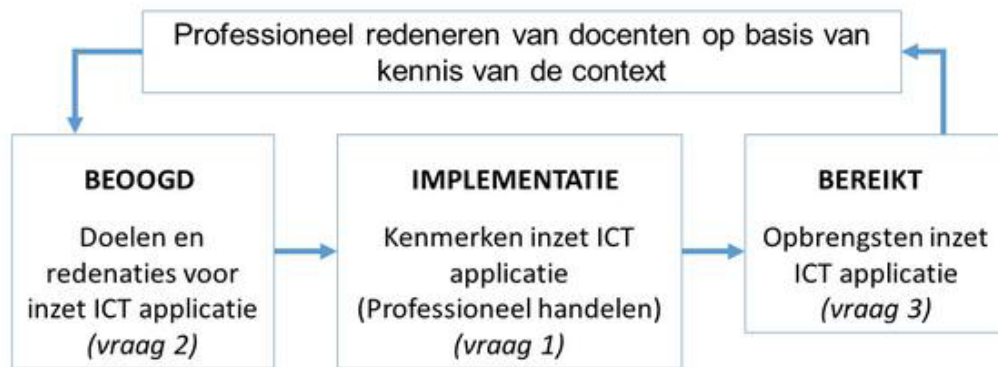
Figuur 1. Onderzoekmodel

verschillende vakgebieden (STEM). Het onderscheid tussen onderwijssectoren komt voort uit verschillen in opzet en uitvoering van onderwijsprogramma's op pabo's en lerarenopleidingen. De aandacht voor bèta-vakgebieden hangt samen met inspanningen om leraren en leerlingen te interesseren voor exacte vakken. De verschillende onderzoeksvragen komen samen in een onderzoekmodel (Figuur 1).